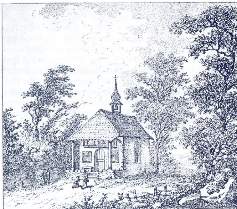
Tellskapelle. Stich von Salomon Gessner (1730–1788)